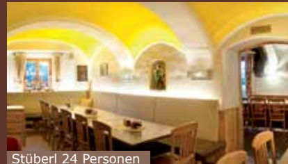
Stüberl 24 Personen