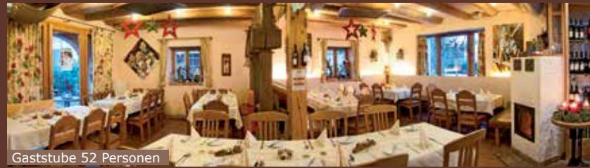
Gaststube 52 Personen

bei höchster Qualität im gemütlichem Rahmen von 1856