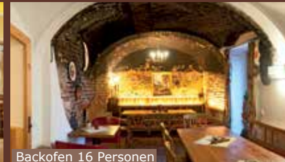
Backofen 16 Personen